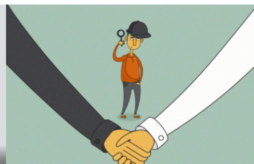
Karteliai viešuosiuose pirkimuose 2019 01 07