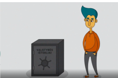
Valstybės pagalba 2019 01 07